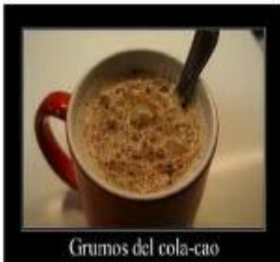
Grumos del cola-cao

En vaso de leche con cacao hay 6 grumos , pero consigas quitar 4. ¿Cuántos grumos quedan en el vaso?