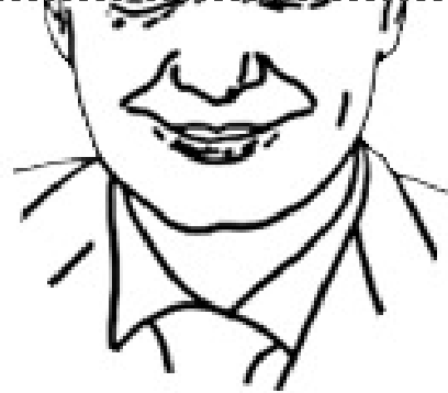
D. José Luis Rodríguez Zapatero