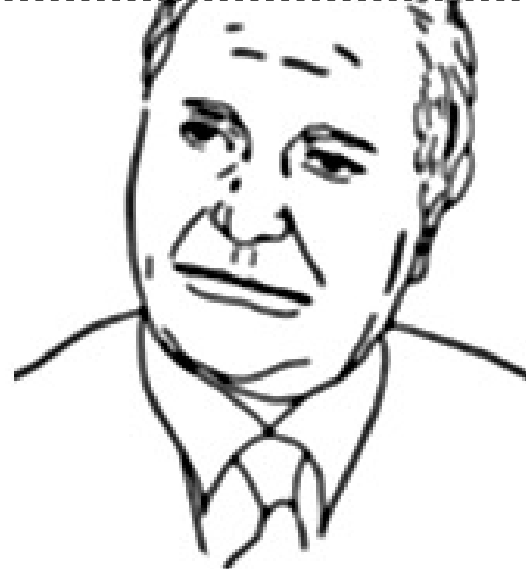
D. José Carlos Divar Blanco (Presidente del Tribunal Supremo y del Consejo General del Poder Judicial)