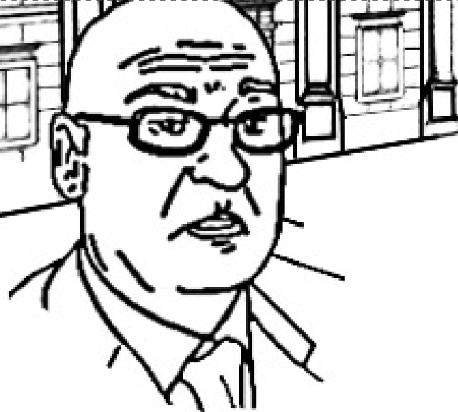
D. Francisco Javier Rojo García (Presidente del Senado)