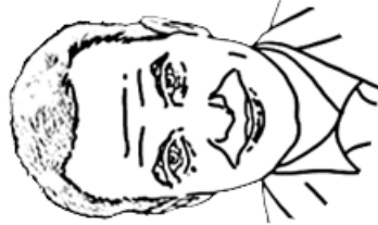
D. José Luis Rodríguez Zapatero