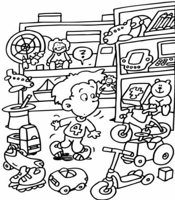
Adivinanza número 5