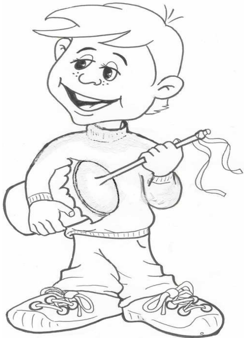
Adivinanza número 4