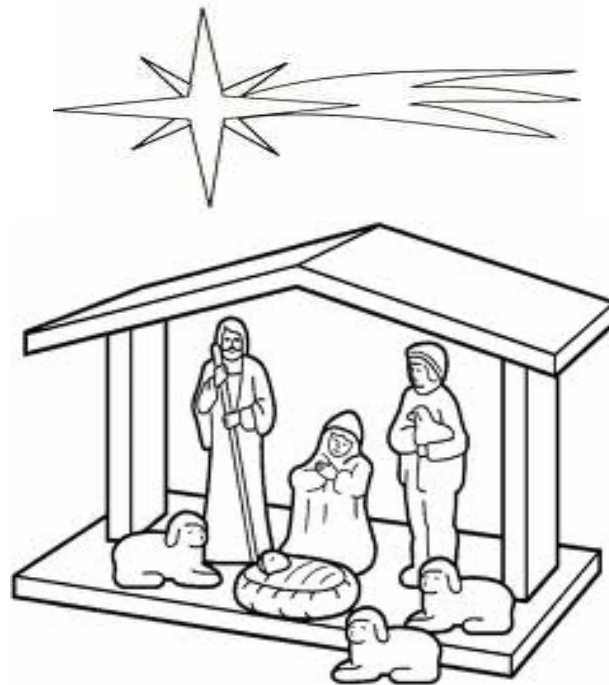
Adivinanza número 2