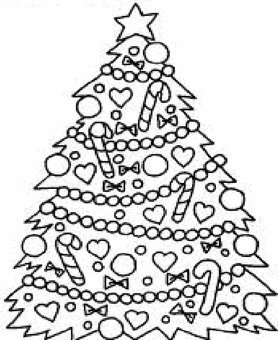
Adivinanza número 1