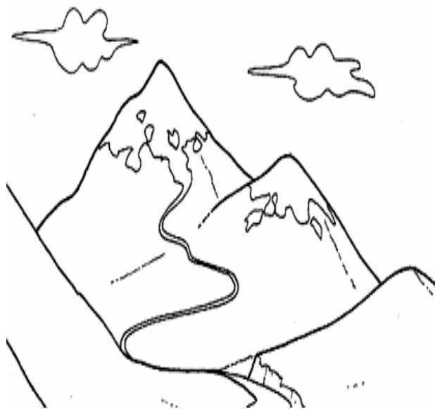
Adivinanza número 2