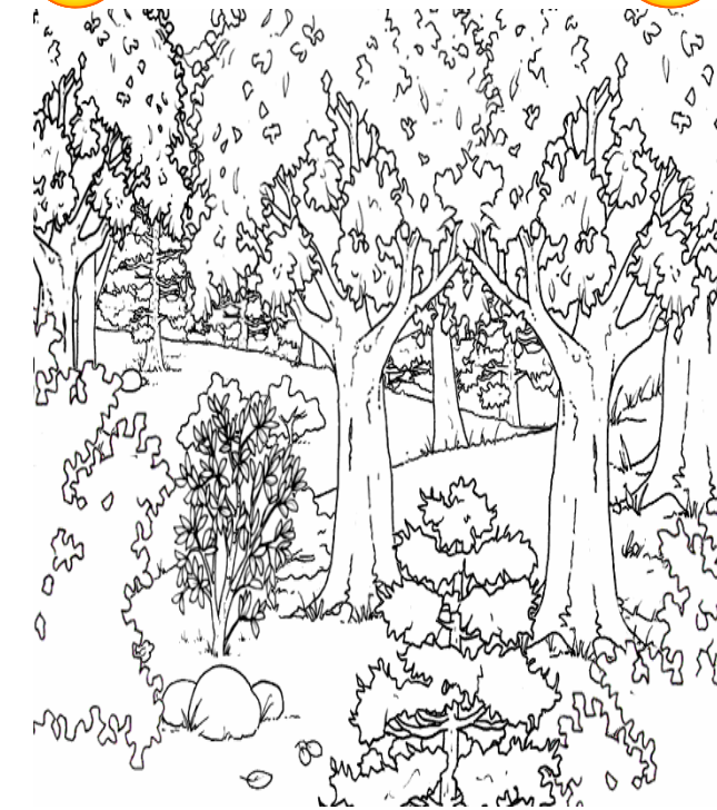
Adivinanza número 3