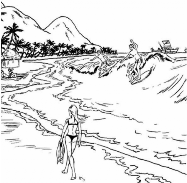
Adivinanza número 1