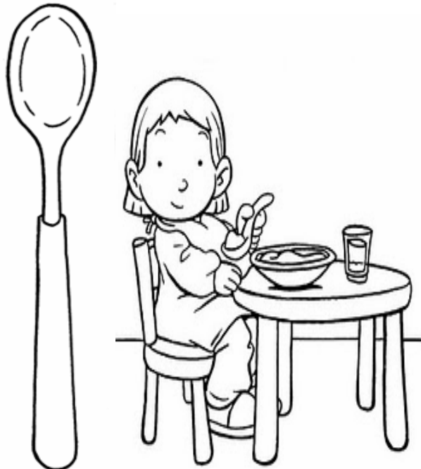
Adivinanza número 1