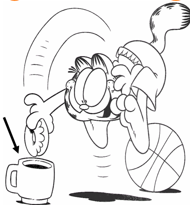
Adivinanza número 5