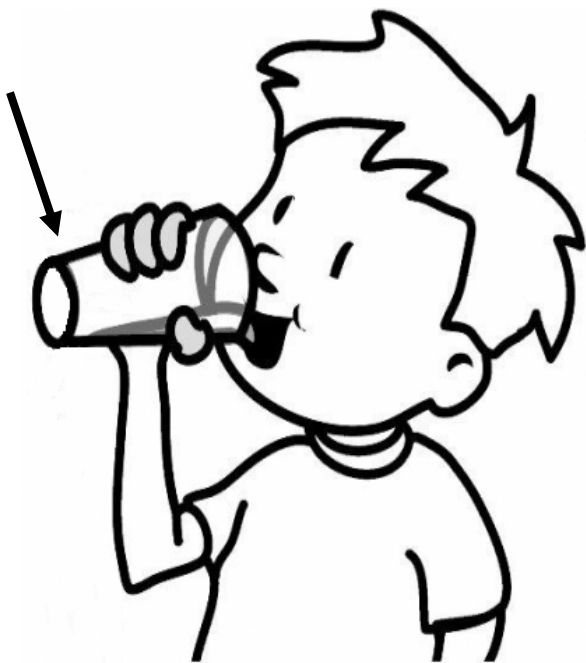
Adivinanza número 4