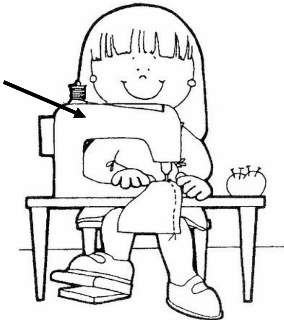
Adivinanza número 5