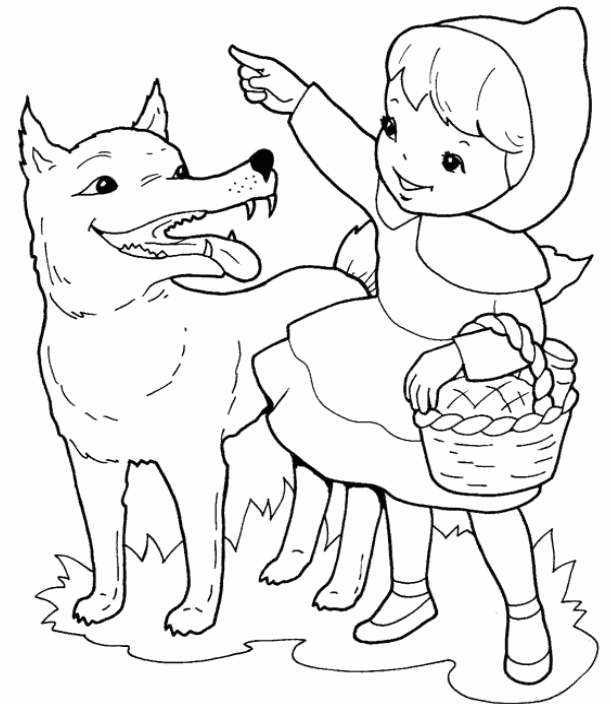
Adivinanza número 3