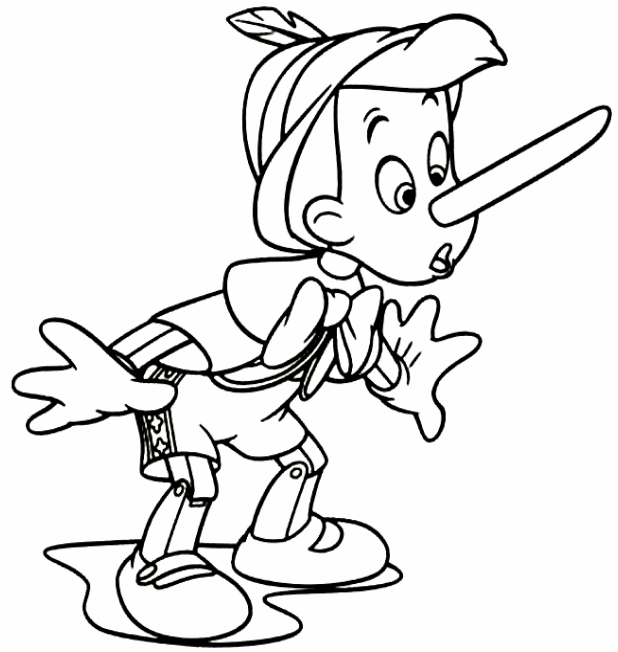
Adivinanza número 5