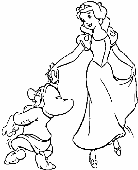
Adivinanza número 1