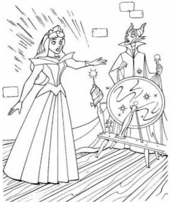
Adivinanza número 4