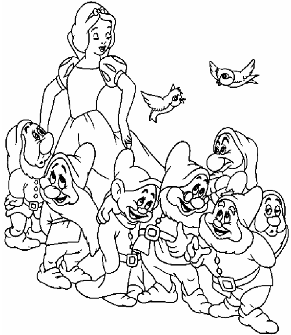
Adivinanza número 4