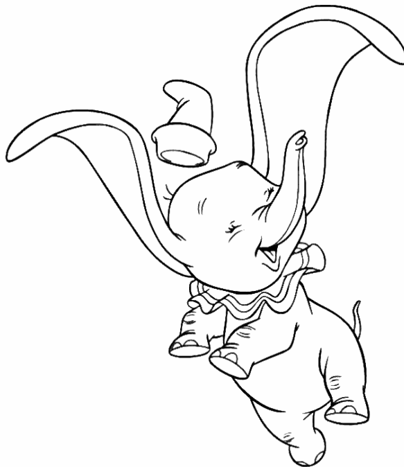
Adivinanza número 2