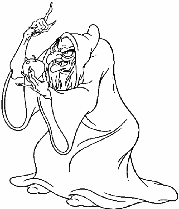
Adivinanza número 1