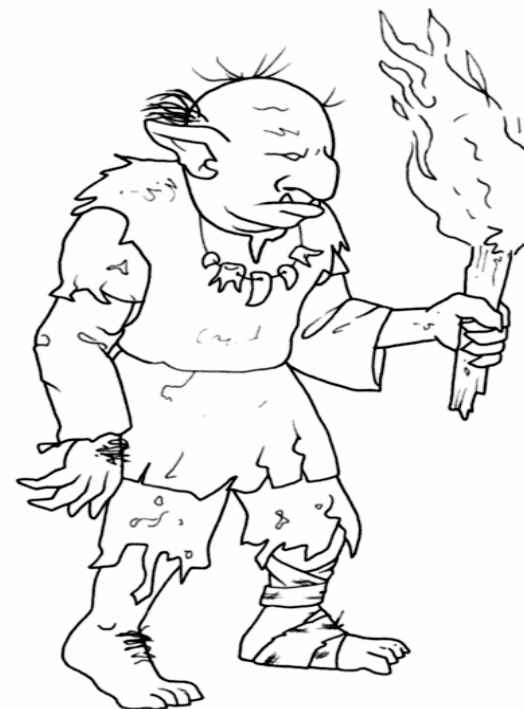
Adivinanza número 3