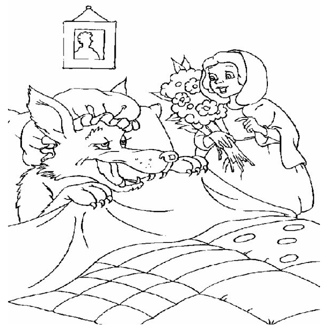
Adivinanza número 4