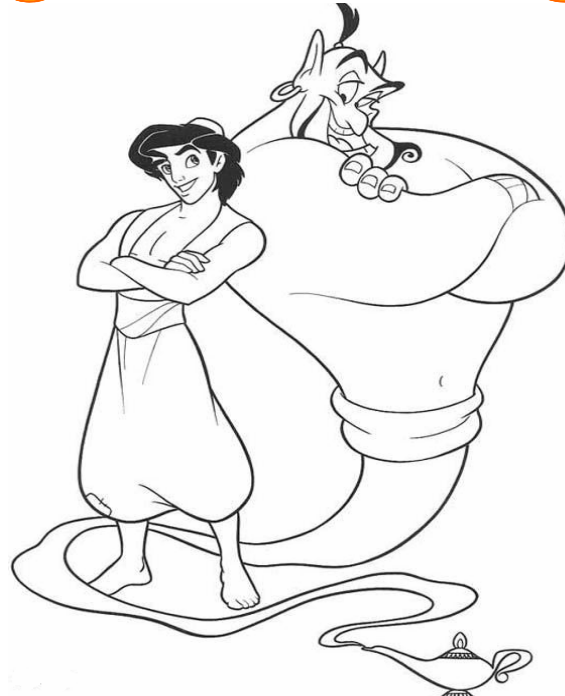
Adivinanza número 2