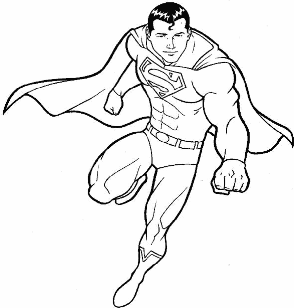
Adivinanza número 1