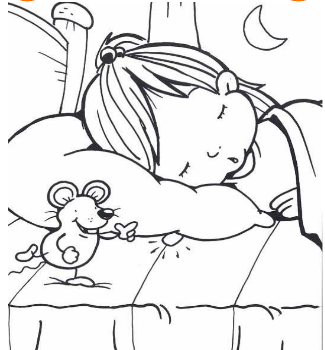
Adivinanza número 4