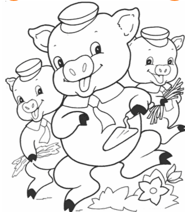
Adivinanza número 3