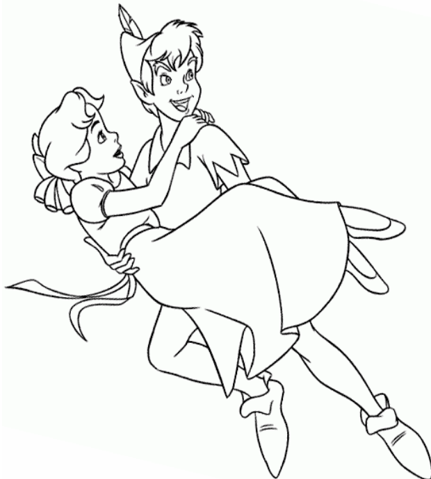
Adivinanza número 5