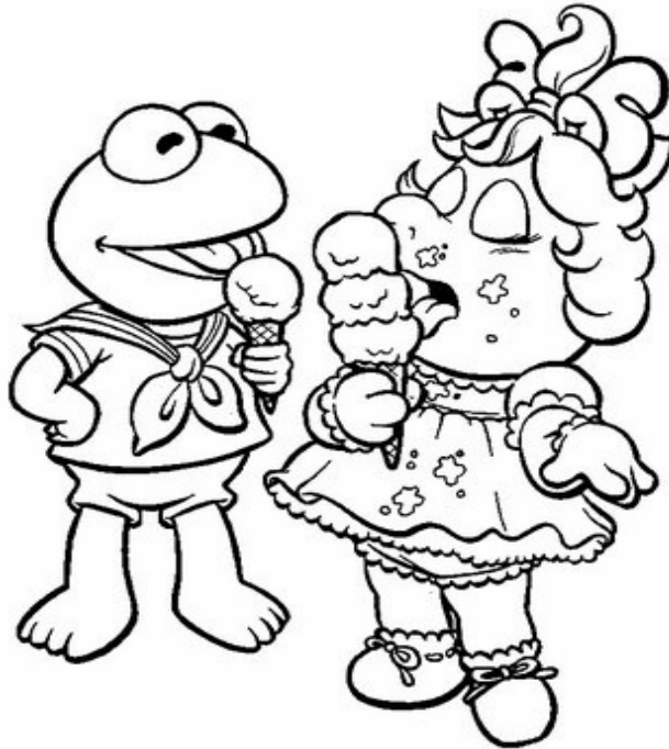
Adivinanza número 5