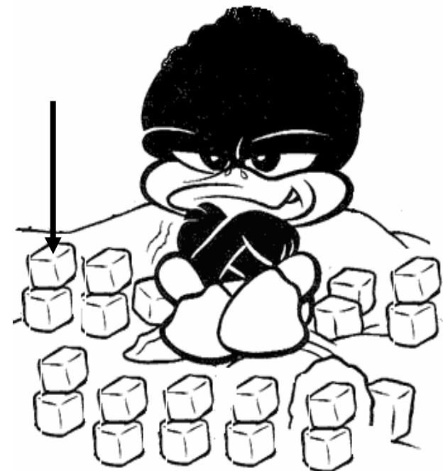
Adivinanza número 3