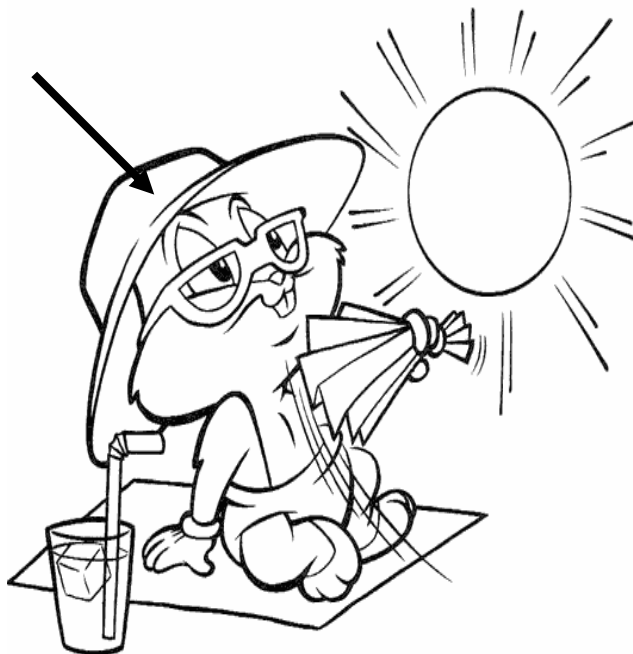
Adivinanza número 2