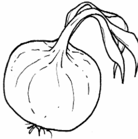
Adivinanza número 2