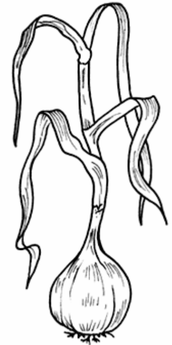
Adivinanza número 3