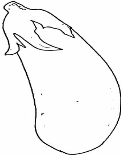
Adivinanza número 5