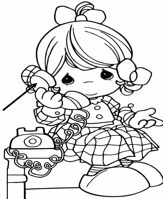
Adivinanza número 5