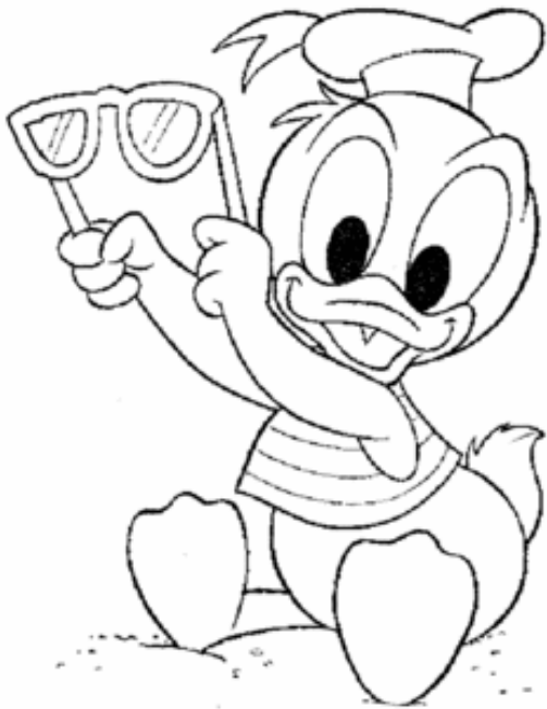
Adivinanza número 4