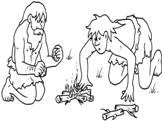
Adivinanza número 1