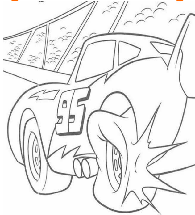
Adivinanza número 2