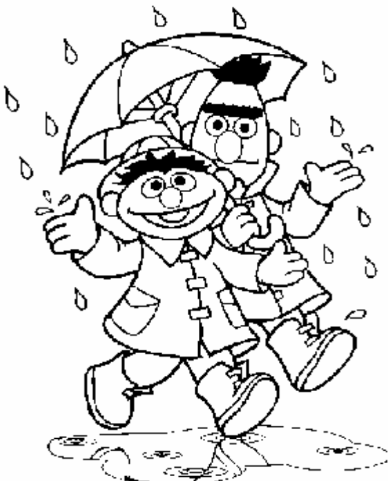
Adivinanza número 2