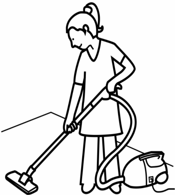
Adivinanza número 4