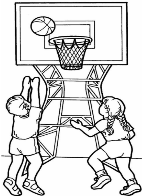
Adivinanza número 2