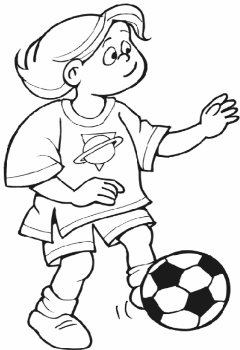
Adivinanza número 1