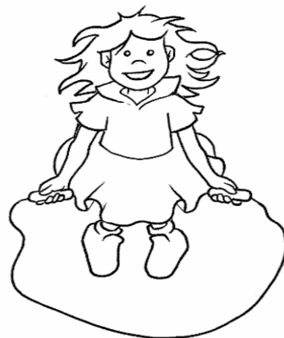
Adivinanza número 3