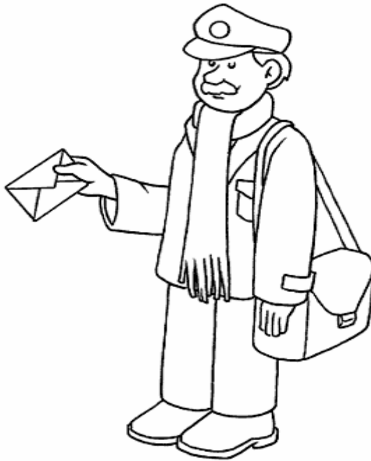
Adivinanza número 5