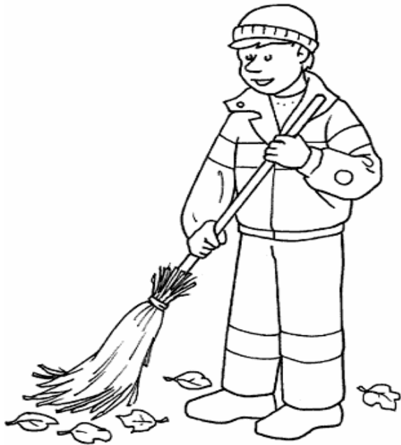
Adivinanza número 1