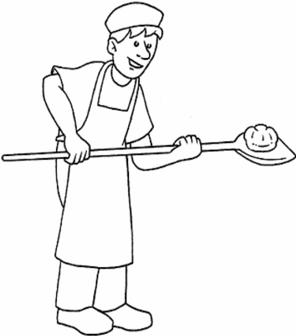
Adivinanza número 4