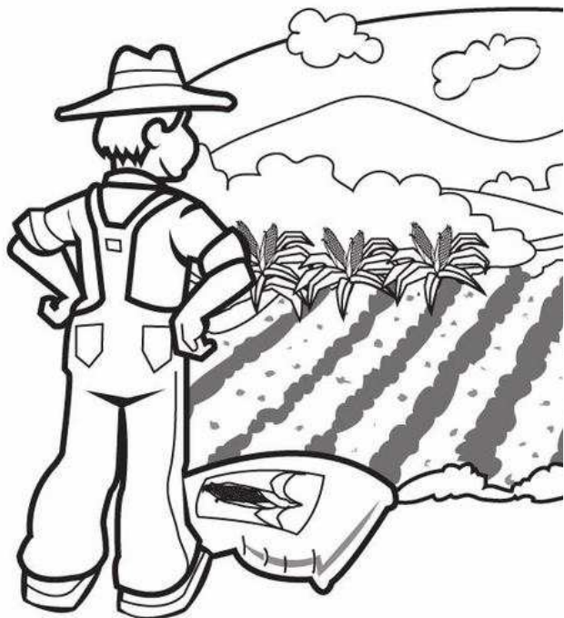
Adivinanza número 4