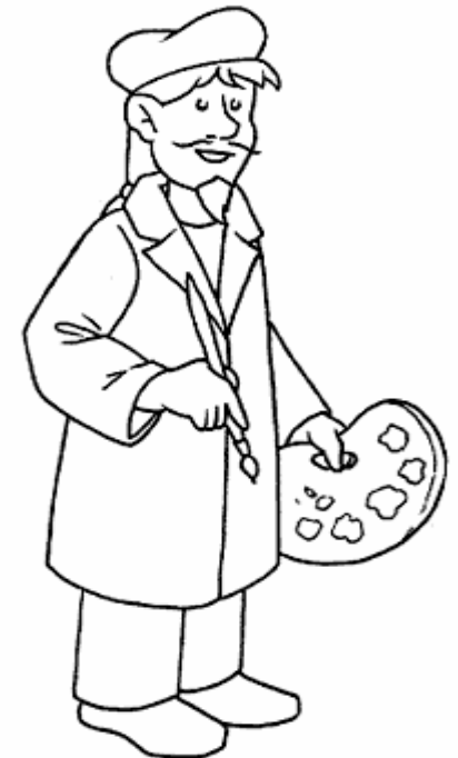
Adivinanza número 3