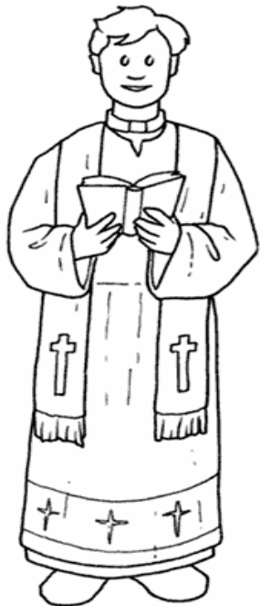
Adivinanza número 1