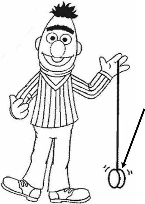
Adivinanza número 4