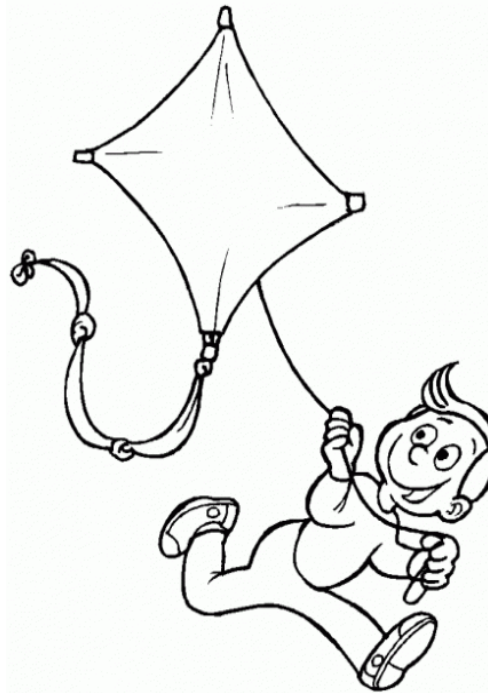
Adivinanza número 2