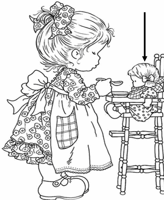
Adivinanza número 5