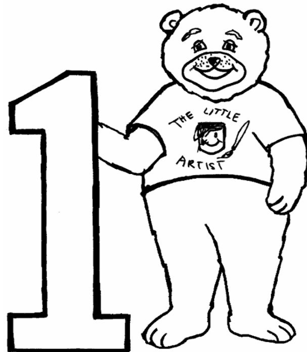
Adivinanza número 3