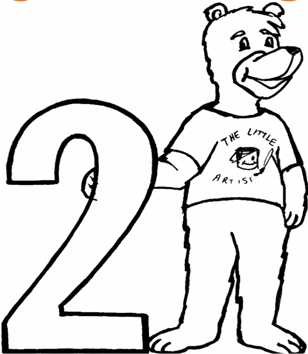
Adivinanza número 4