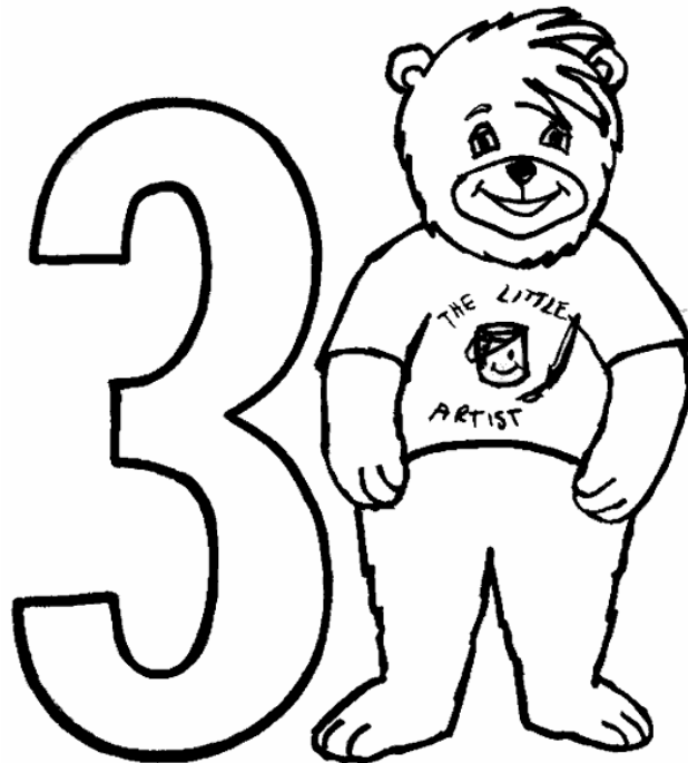
Adivinanza número 5