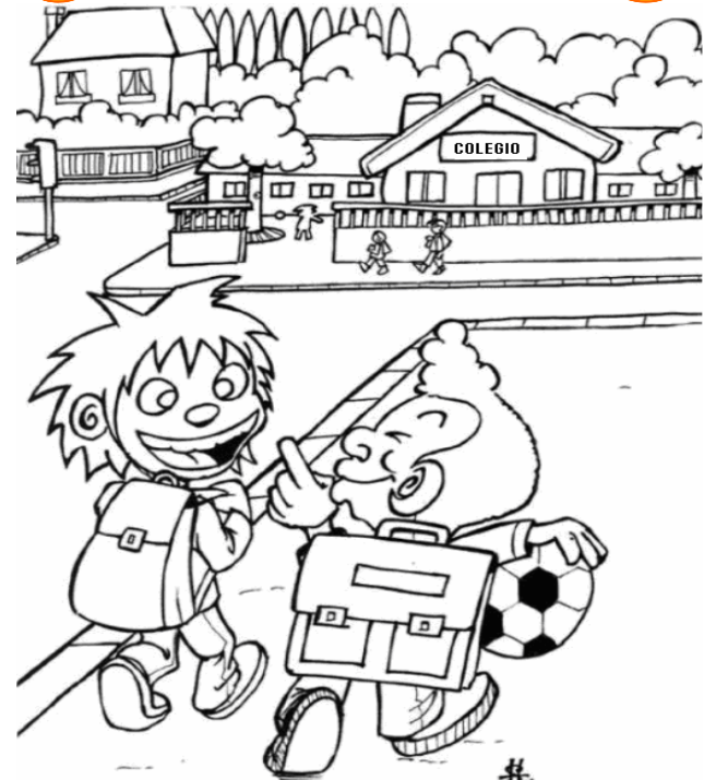
Adivinanza número 1