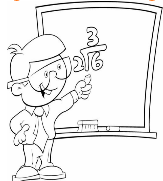
Adivinanza número 3