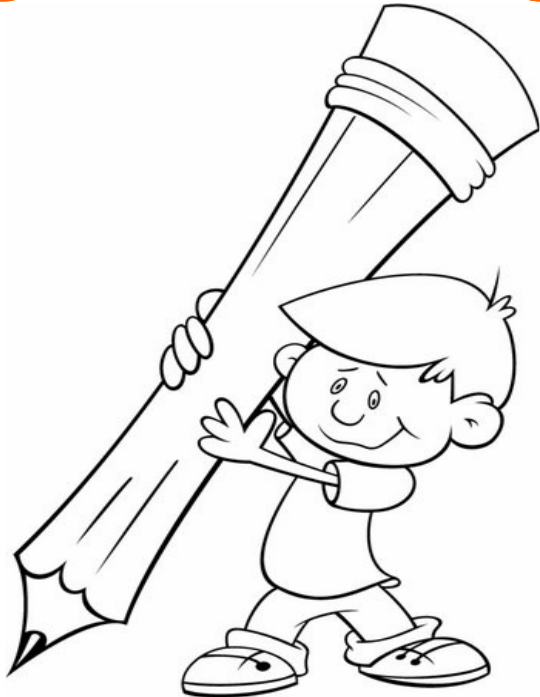
Adivinanza número 4