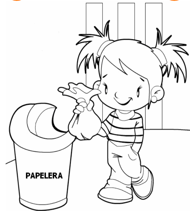
Adivinanza número 2