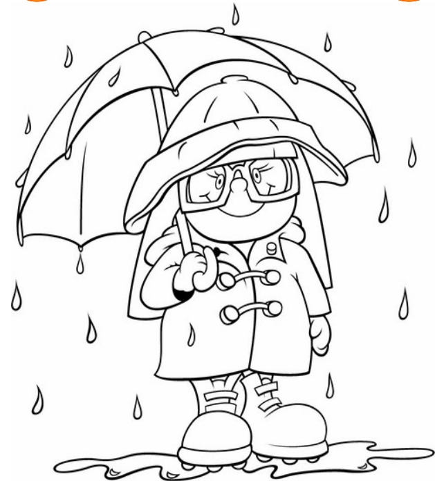
Adivinanza número 1