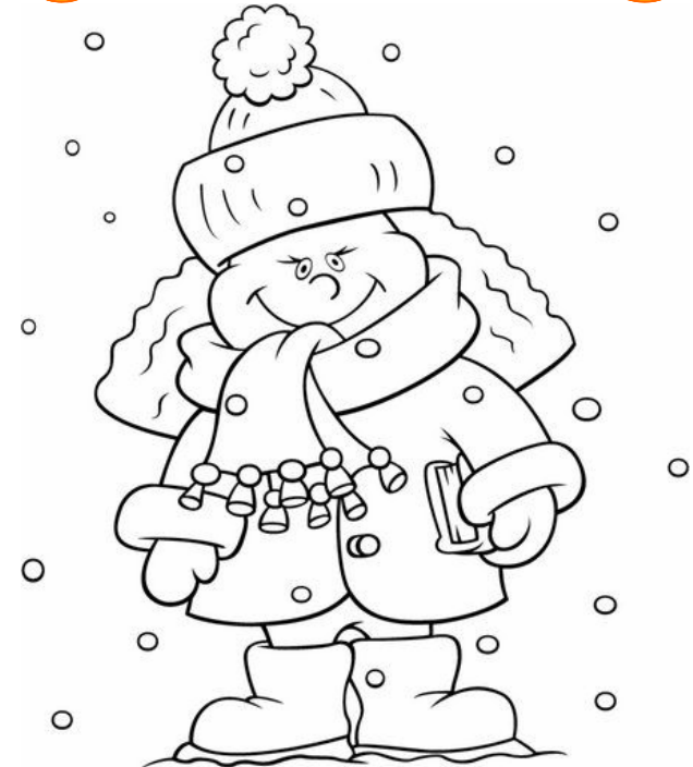
Adivinanza número 2