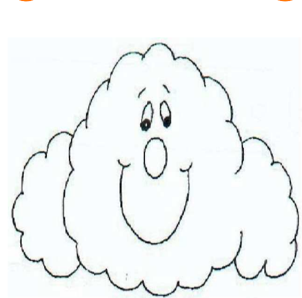
Adivinanza número 3