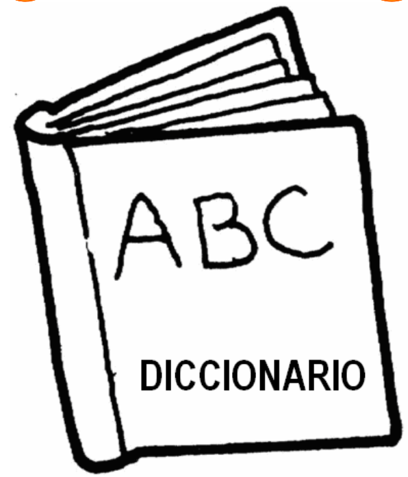
Adivinanza número 3