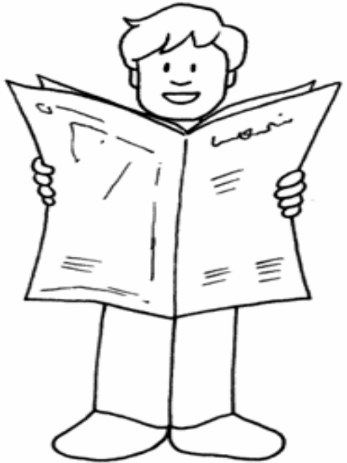
Adivinanza número 4