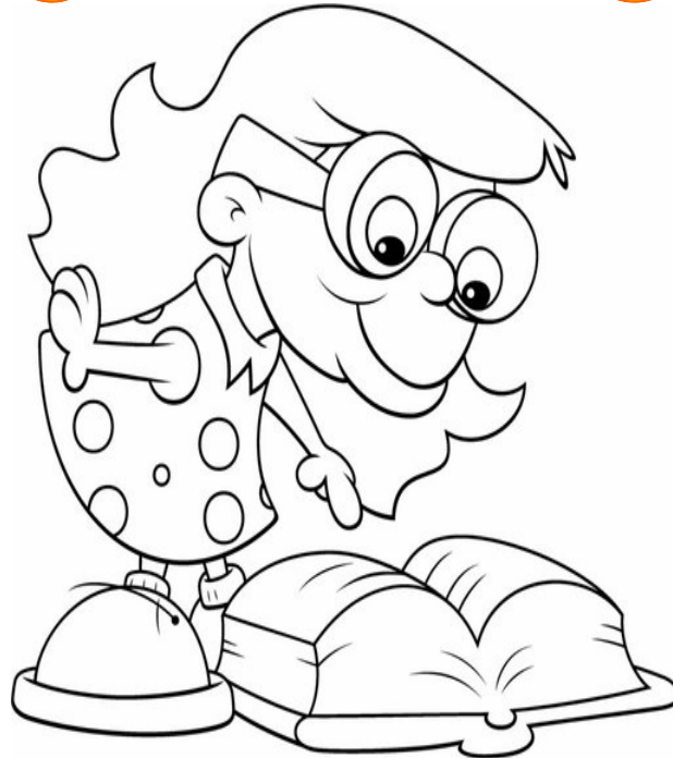
Adivinanza número 2