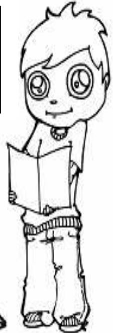
Adivinanza número 5