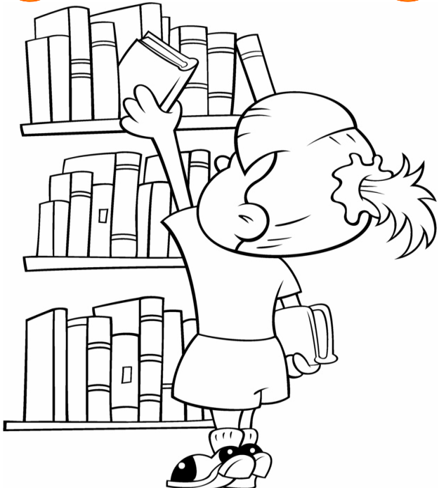
Adivinanza número 1