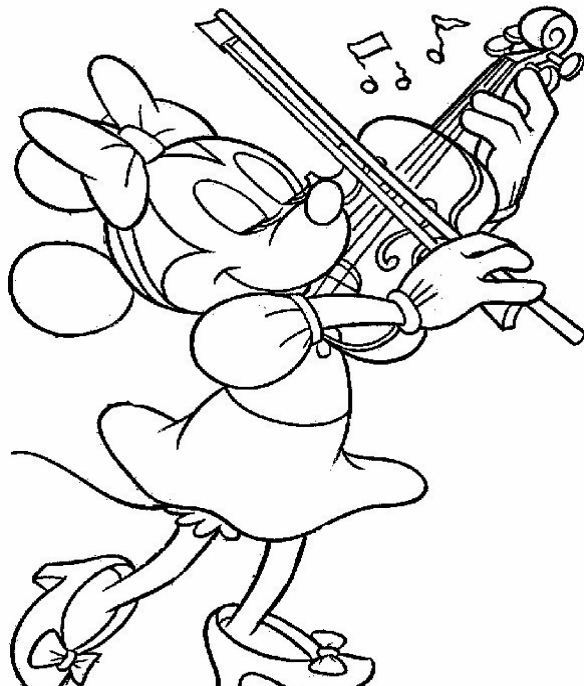
Adivinanza número 5