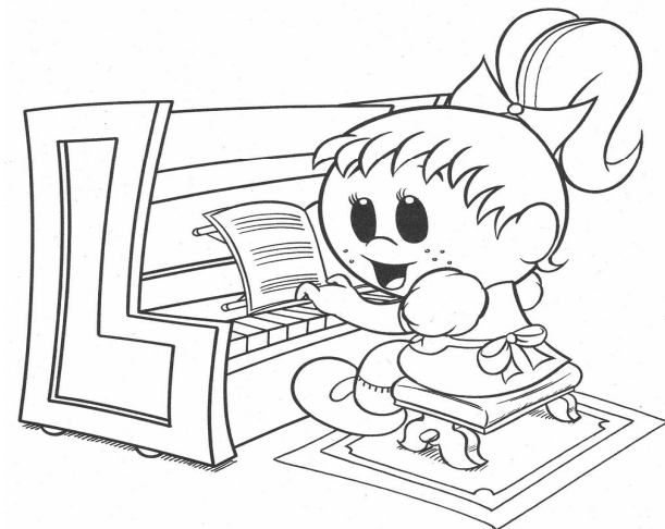
Adivinanza número 3