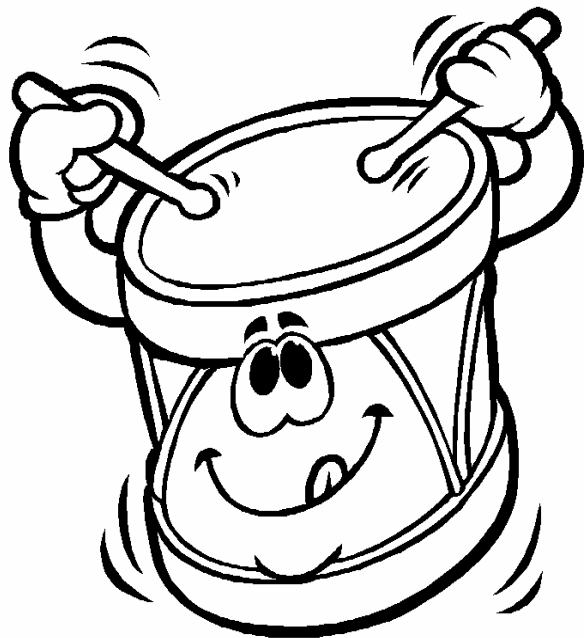
Adivinanza número 1