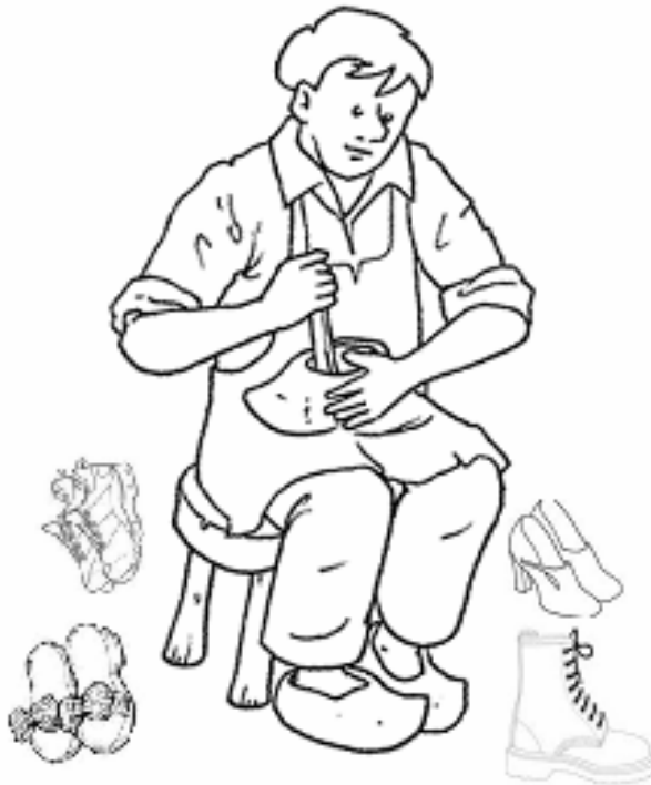
Adivinanza número 2