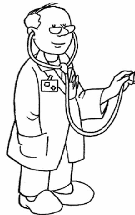
Adivinanza número 3