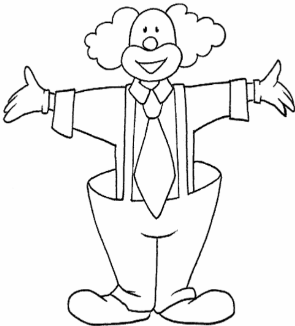
Adivinanza número 1