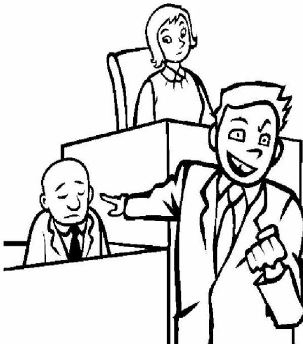
Adivinanza número 2