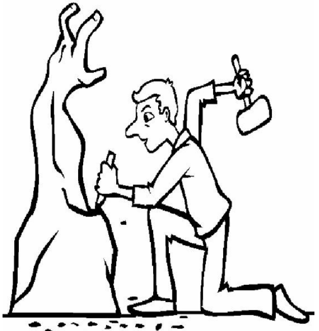
Adivinanza número 5