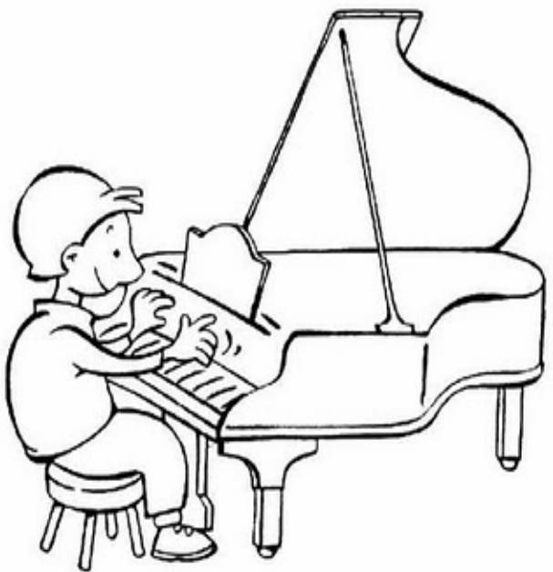
Adivinanza número 4