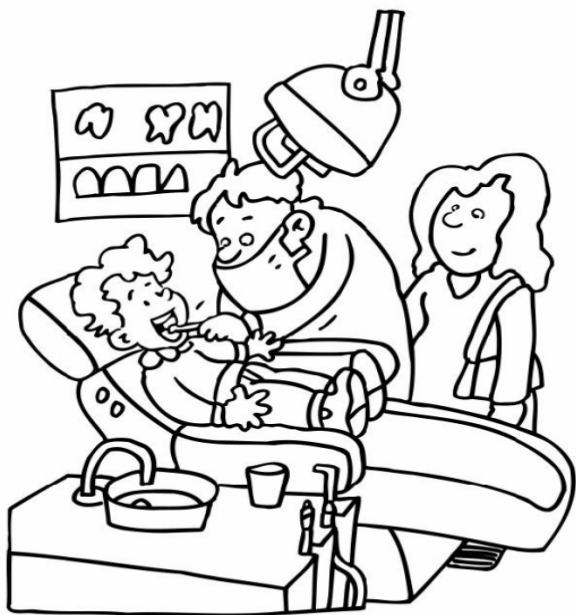
Adivinanza número 1