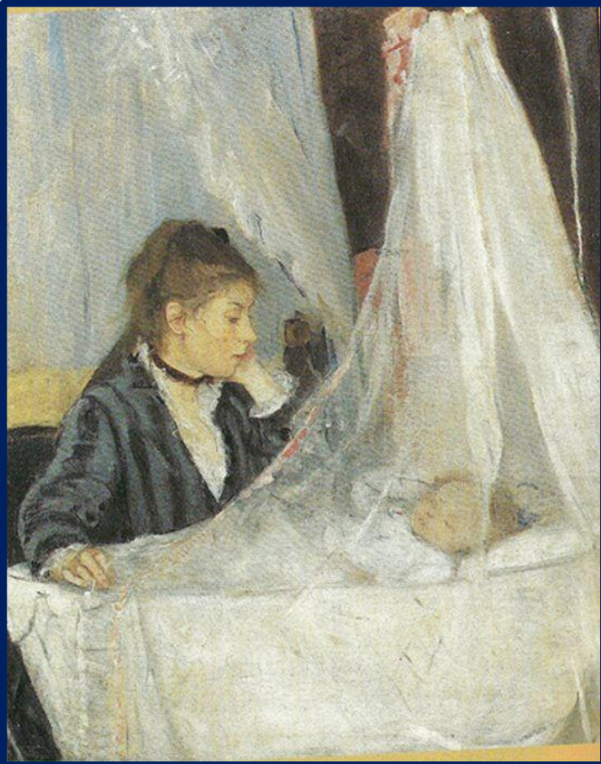
“La cuna”, Berthe Morisot

La nana infantil “A dormirse mi niño/a que viene el coco”, siempre la he cantado en Educación Infantil, de 3 años. Me ha servido para momentos concretos de relajación y era muy divertido: la chiquillería esperando, en el corcho, con los ojillos cerrados que yo les diera palmaditas en la espalda. Era un acto de cariño que me agradecían con sus anhelos.