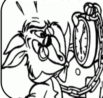
EL RELOJ DE BOLSILLO