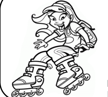
EL PATÍN DE RUEDAS