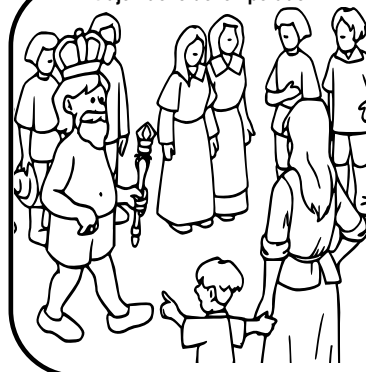
El traje nuevo del emperador