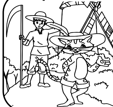
El gato con botas