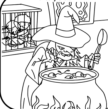
Hansel y Gretel