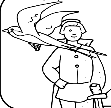
El príncipe feliz