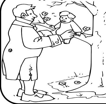
El gigante egoísta

Autor: Hans Cristian Andersen En el año: 1838