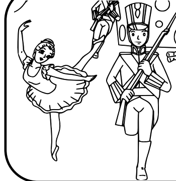
El soldadito de plomo