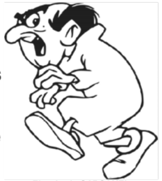
El malvado GARGAMEL

No usan nombres propios para tratarse entre sí. Todos tienen el mismo tamaño, apariencia y vestimenta; pero entre ellos se distinguen. ¿Sabrías tú distinguirlos? Realiza las divisiones y el resto te dirá su nombre, según la CLAVE.