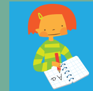
Derecho a la educación.