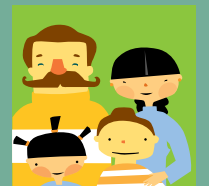
Derecho a crecer en una familia.