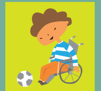
Derecho a desarrollarse plenamente.