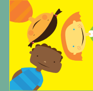
Derecho a la igualdad, sin ningún tipo de distinción.

El 20 de noviembre se celebra la fecha en la que, en 1959, la Asamblea General de las Naciones Unidas aprobó la Declaración sobre los Derechos del Niño y en 1989 la Convención sobre los Derechos del Niño. Os proponemos este juego para recordar cuales son estos derechos.