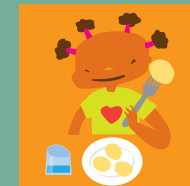
Derecho a la salud y a la alimentación.