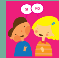
Derecho a expresar las opiniones.s.