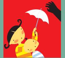
Derecho a la protección.