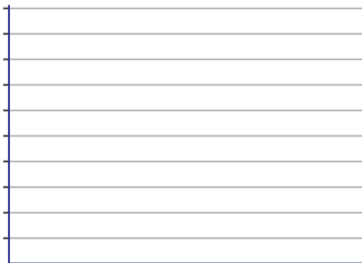
DIAGRAMA DE BARRAS