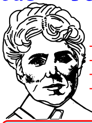
Rosalía de Castro