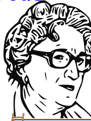
Carmen Martín Gaité Rosa Chacel