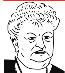
Emilia Pardo Bazán