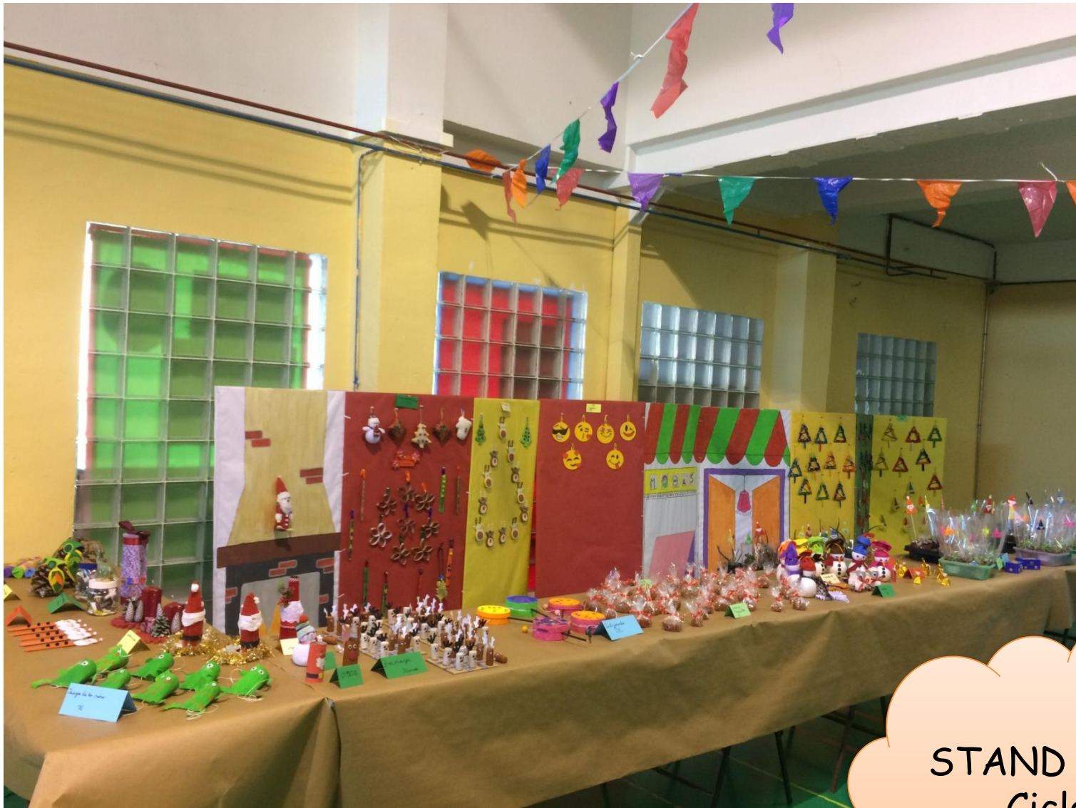
STAND de 1º Ciclo